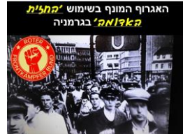
האגרוף המונף בשימוש 'פחית' החזית האדומה בגרמניה