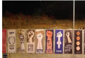
כרזות אגרוף של "הטובים" בנתיבי אילון

אומנים ישראלים לא בחלים באמצעים כרי להגיש לעולם את מה שזדא רוצה לראות, ומתעפים זאת על פני עשייה מק צועית, איסתית וישה. כך למשל, התערוכה שלוש ערים נגד העומה, שדוצגה בסרילין ובנירירוק, הציגה את חמת ההפרדה הישראלית כדרך להארץ את סכל העם הפלסטיני. אומנים אודיים שם יצאו בהצדה רשמית נגד עמים השולטים באמצעות רצח עם על הרכבם הרמורפי. בתערוכה לא נשמעה וקעתם של מאות האודיים - סלל ידיים רכים ותיוגות - שרצחו כשרד הפלסטיני, שבגללה נבנתה חמת ההפרדה לסתחילה. האמנות הישראלית מניסת לתמיכה בתנועות בינלאומיות הקודרות להחרים את ישראל "בשם הצדק העולמי", זאת כמסדה להדכנס לגלריות בעולם בתנאי סף נמוכים. האם אלו הדברים שאומני ישראל אמורים להציג בגלריות אירופה ובפסטיבל ברילין - עיר שממנה נעשו פשעים מתחמורים שירע הזמן האנטישמי האומנים לא לבד. נציגי ישראל בכנס האדריכלים הביני לאומי בסרילין התכוונו להציג את האדריכלות בישראל - בשם הרמיקסית והפשיסטי - ככואת שעוסקת בכפייתיות בבנייה כחנית בשטחים הכבושים תחת הכותרת "הקשר בין האדריכי לוח הישראלית למדיניות הכיבוש". הכחה של התערוכה הצרי גה את מרחב התכנון בהתנהלויות שביהודה וכשמרחק ככתם דם, מעין נביאה שכלמעט הגשימה את עצמה ב-7 באוקטובר גם