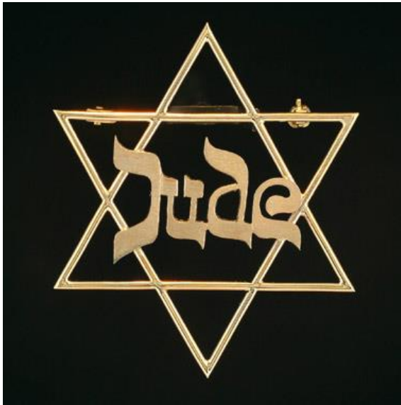
מתוך תערוכת "ראי השטן" - סוג אומנות המאפשר סף כניסה לגלריות בברלין ניו-יורק וכדומה.

נילי פורטוגלי, אדריכלית ומרצה לאדריכלות בפקולטה לאדריכלות ובינוי ערים בטכניון