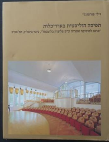
הספר הוא דו-לשוני ומוקדש כולו אמנם לבניין מרכז המוסיקה, אך פורטוגלי האריכה והציגה את גישתה התכנונית כמו גם עבודות אחרות שלה ולכן ניתן דרכו ללמוד בכלל על יצירתה.