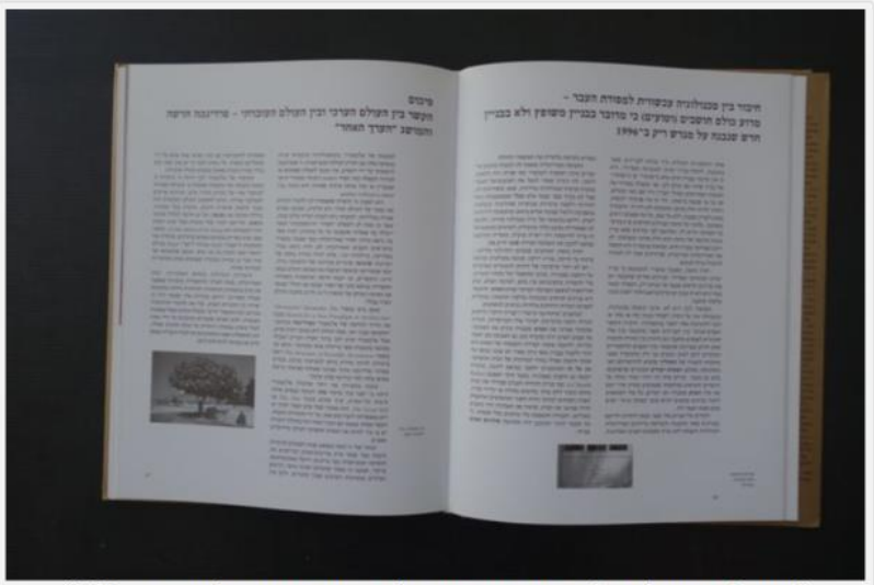
"מדוע כולם חושבים (וטועים) כי מדובר בבניין משופץ ולא בבניין חדש שנבנה על מגרש ריק ב-1996"

את דרכה המקצועית מחלקת האדריכלית נילי פורטוגלי (נולדה ב-1948) לשלושה פרקים: תכנון מבנים, כתיבת ספרים ויצירה קולנועית. אם יש אדריכל ישראלי עם גישת תכנון מובהקת זה ללא ספק פורטוגלי. שיטת העבודה שאותה היא פתחה בעקבות לימוד תפיסת עולמו של האדריכל כריסטופר אלכסנדר, הניבו שורה ארוכה של מבנים ביעודים שונים – כמו מבני קהילה, דת, מוסיקה, מגורים. כאן בבלוג כתבתי על הספרייה למוסיקה שתכננה בבית אריאלה וב-xnet על העבודה הראשונה שתכננה וכן על זו האחרונה . ספרה הראשון והעיקרי, The Act of Creation and the Spirit of Place (תהליך היצירה ורוח המקום, תפיסה הוליסטית – פנומנולוגית באדריכלות), יצא באנגלית וסוקר את עבודותיה, למעט זו האחרונה שהוקמה רק לאחר שהספר יצא. ספר נוסף שפרסמה פורטוגלי, תפיסה הוליסטית באדריכלות – מרכז למוסיקה וספרייה ע"ש פליציה בלומנטל, הוקדש למבנה ציבור מיוחד שתכננה בכיכר ביאליק. המרכז נחנך ב-1997 אך בגלל מראהו כולם חושבים שמדובר בבניין שהיה שם תמיד. שני הספרים כמו המבנים והסרט שיצרה, מייצגים היטב את גישתה ואת דמותה של פורטוגלי החל מהכריכה המוזהבת ובהמשך עד לירידתה לפרטים הקטנים ביותר. גם אם הטקסט לא ערוך לגמרי וגם אם סידור התמונות ראוי היה ליד מקצועיות יותר, אלה עדיין שניים מהספרים היותר מוצלחים שיצאו לאדריכלים בישראל, ספרים שדרכם ניתן ללמוד ולהבין את תפיסת עולמה וגישתה התכנונית ובעיקר ניתן באמצעותם להעריך את תבונתה ויצירתה. ניתן לרכוש באמזון, או ישירות מפורטוגלי (nili_p@netvision.net.il) באיסוף עצמי ובהנחה כשמחירו 250 שקלים. את הספר השני ניתן לרכוש באתר הוצאת עם עובד במחיר 82 שקלים.