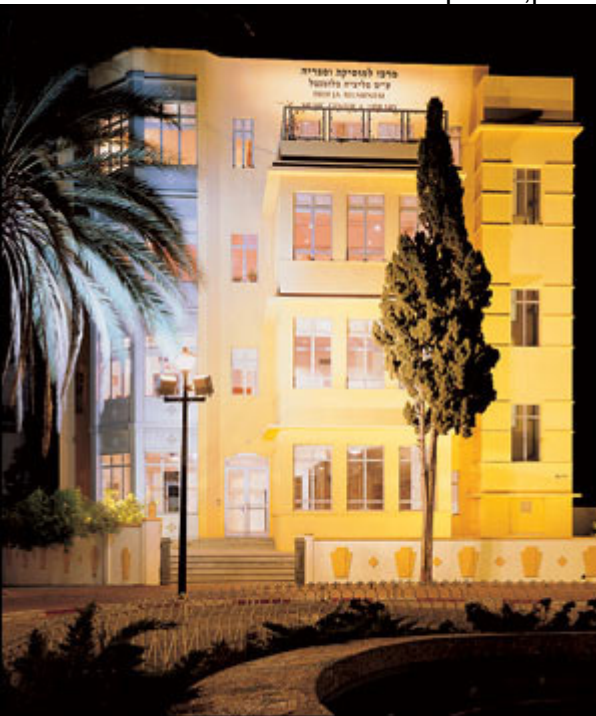
בית צריך להיות חלק מהעיר. צילומים מתוך ספרה של נילי פורטוגלי

בספר חדש מנסה האדריכלית הישראלית נילי פורטוגלי להציע אלטרנטיבה לאותו עיצוב שמנסה, לטענתה, להפוך את כל העולם לדף באותו מגזין ארכיטקטורה מבהיק. במקום זה היא מציעה גישה הוליסטית, שבה כל הדברים קשורים אחד בשני ואין מרפסת בלי הרחוב שאליו היא פונה.